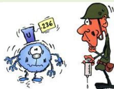
Alourdie d'un neutron, la victime devient très instable...

Après qu'on lui ait inoculé un neutron, le pauvre ^{235}\text{U} s'alourdit d'un nucléon, se transformant en ^{236}\text{U} , un gros lourdaud de la famille Uranium qui n'arrive plus à maintenir toutes ensemble les particules de son noyau. Comme une goutte d'eau qui devient trop grosse et se divise en deux gouttelettes plus petites, le pauvre ^{236}\text{U} éclate et se fragmente en deux noyaux plus petits (par exemple le krypton 92 et le Ba 141), expulsant en même temps deux ou trois neutrons rapides.