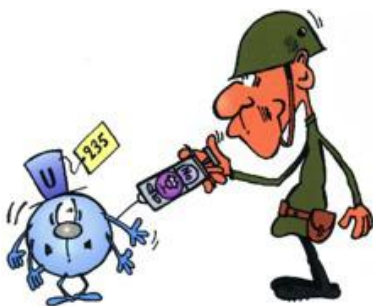
Le virus est un neutron

L'Uranium 238 peut aussi être victime de la fission spontanée, une maladie heureusement beaucoup plus rare que la décroissance radioactive.