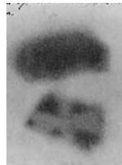
Plaque photographique d'Henri Becquerel : on y distingue les contours d'une croix en cuivre qu'il avait placée entre les sels d'uranium et la plaque sensible.

Henri Becquerel, note à l'Académie des sciences, 1896.